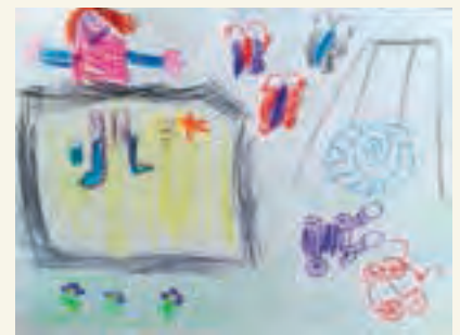
Im neuen Garten, von Theresa (5 Jahre)